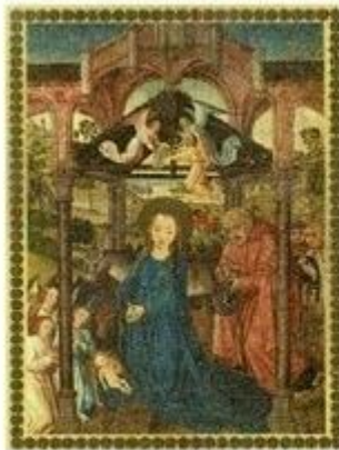
La Natividad. Maestro de Sopetrán. Museo Nacional del Prado. Madrid.